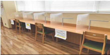
隣り合った席を使用禁止に している様子(忠生図書館)