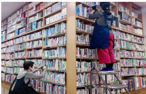
蔵書点検を行っている様子

開館時に気持ちよく図書館を利用できるように、蔵書点検といわれる棚卸し業務を行いました。これは、図書館が所蔵する100万点を超える資料を本来あるべき棚に戻す作業です。これにより、本を探しやすくなりました。