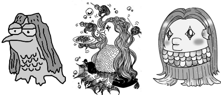
図書館職員による妖怪アマビエのイラスト