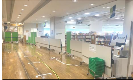
立ち入り場所を制限している様子 (中央図書館)

予約資料の受取りサービスを行いました。中央図書館では、予約受取コーナーのみ利用できるように、入口から立ち入れる場所を制限させていただきました。